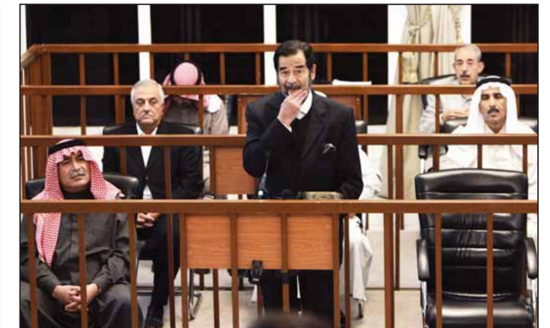
صدام في القفس