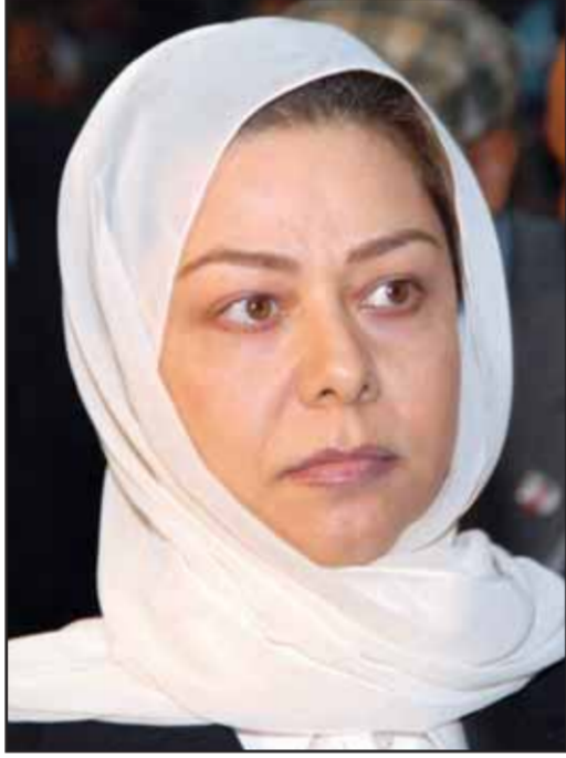
رغد صدام حسين