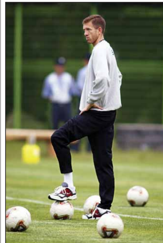
● لقطة ارشيفية لكاتانيتش خلال قيادة أحد التدريبات

وسبق لكاتانيتش (٤٦ عاماً) ان درب منتخب سلوفينيا وقاده الى كأس الامم الأوروبية ٢٠٠٠ ومونديال ٢٠٠٢ في كوريا الجنوبية واليابان للمرة الاولى في تاريخه، كما اشرف على منتخب مقدونيا منذ عام ٢٠٠٦ قبل ان يستقيل من منصبه في ٤ الجاري لخلافه مع المهاجم غوران بانديف.