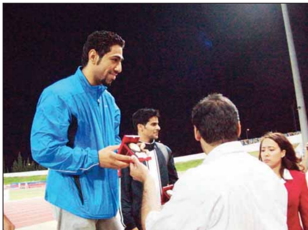
● الصبغة يتسلم الميدالية الذهبية

فعاليات البطولة: «نهدي الميداليات والتتويجات التي حققها الفريق في بطولتي تونس والجزائر إلى سمو الامير وسمو ولي العهد والهيئات الرياضية والشعب الكويتي».