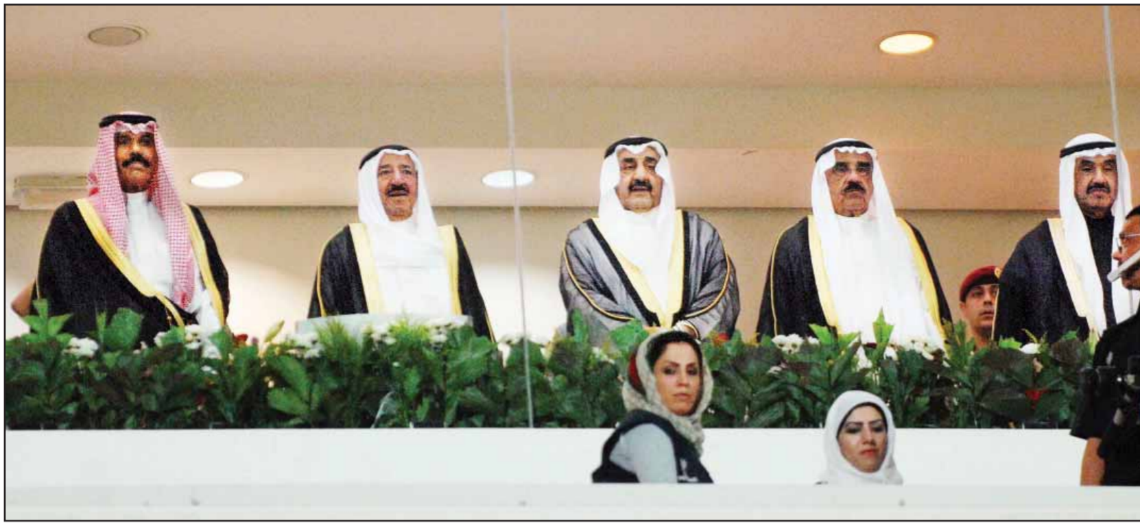
● الأمير ولي العهد وإلى يسارهما الخرافي و فيصل اليوسف و ناصر المحمد