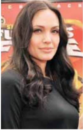
• أنجلينا جولي

أعربت الممثلة الأميركية أنجلينا جولي عن سعادتها الغامرة بالتغيير، الذي أحدثته دورها كأم في حياتها. ونقل موقع فيمبل فيرست الإلكتروني البريطاني عن جولي قولها: أشعر الآن بالرضا أكثر مما كنت أتوقع، وأضافت اعتقد أنني سأصبح مثل أمي وسأشبهها كثيراً في المستقبل، كما أنني أصبحت أكثر رقة وعطاء منذ أن أصبحت أما.