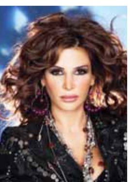
• نيللي مقدسي

أكدت المطربة اللبنانية نيللي مقدسي تطلعها للدخول في مجال التمثيل من خلال مسلسل بدوي على مستوى «نمر بن عدوان» و«صراع على الرمال»، متسيرة إلى أنها تفضل التعاون مع الممثل الأردني ياسر المصري أو تيم حسن، ومن نجوم الدراما التركية، فهي تفضل أن تشارك «أسمر» بطل مسلسل «ومتضي الأيام».