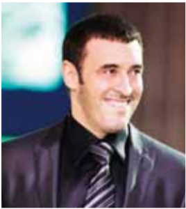
• كازم الساهر

أحيا كازم الساهر مساء الخميس الماضي حفلاً غنائياً بمنتهى بنين تري العين، ويعتبر هذا هو الحفل الأول بعد وفاة والدته، ويرغم الحزن الذي كان يبادي عليه إلا أنه كان كعادته، مبتسم الوجه مستدفق الشعور، وأمتع جميع من حضروا الحفل.