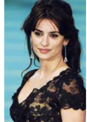
• بينولوبي كروز

لوس أنجلوس- د.ب.أ- أكدت الممثلة الإسبانية الحسنة بينولوبي كروز (٣٤ عاما) أنها لا تخاف من تقدم العمر، وقالت: «العمر لا يخيفني على الإطلاق.. كنت أشعر ببعض القلق ولكنني تجاوزت معظم هذه الأمور». وأشادت نجمة هوليوود الشهيرة في الوقت نفسه بنجمات الجيل القديم في هوليوود وقالت: «عملت مع جودي دينش.. عندما تدخل (جودي) إلى غرفة ما يشعر المرء كأنها تحمل مصباحا بداخلها، فهي تضيء كل ما حولها». وأشادت كروز بمدى الجاذبية التي تتمتع بها نجما مثل ميريل ستريب وصوفيا لورين وقالت: «صوفيا عمرها الآن ٧٤ عاما ولا تزال جذابة.. في كل مرة أتحدث معها تسرد لي الكثير من الحكايات الرائعة عن التمثيل في الزمن الماضي.. تربطني بها علاقة صداقة جيدة».