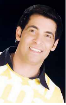
• سعد الصغير