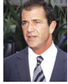
• ميل جيبسون

رفعت زوجة الممثل الأميركي ميل جيبسون دعوى قضائية للطلاق بعد زواج دام ٢٨ عاما. وذكر موقع «تي إم زد كوم» الإلكتروني أن روبين جيبسون رفعت دعوى قضائية لطلب الطلاق الاسبوع الماضي بدعوى خلاف شديد نشب بينهما. ويذكر أن الزوجين لديهما سبعة أطفال، بينهم قاصر واحد يدعى توم (عشرة أعوام). وأضاف الموقع الإلكتروني أن الزوجين لم يوقعا اتفاقية قبل الزواج، ومن ثم فإن جميع الممتلكات والأصول ستقسم بالتساوي بينهما وفقا لما ينص عليه قانون كاليفورنيا. وقدرت ثورة جيبسون بنحو ٩٠٠ مليون دولار. وأفادت عريضة الدعوى بان روبين جيبسون تطلب بالحضانة الجسدية والقانونية المشتركة لطفله توم والنفقة الزوجية واتعاب المحامين.