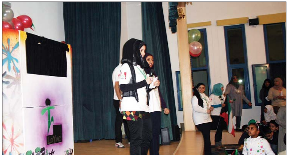
جانب من مسابقات الأطفال