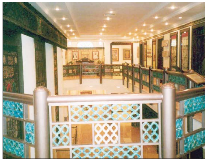
• من الداخل

واضاف قائلاً: نذكر الجماعة في البلدية بأنه فاتهم توجيه اذار آخر لمتحفنا القديم الرئيسي في المنطقة نفسها في الشارع الخامس، فهل مطلوب ايضا ان تتوجه بلدوزرات البلدية لهدم المتحفين على ما فيهما من فن وتراث اسلامي عريق؟