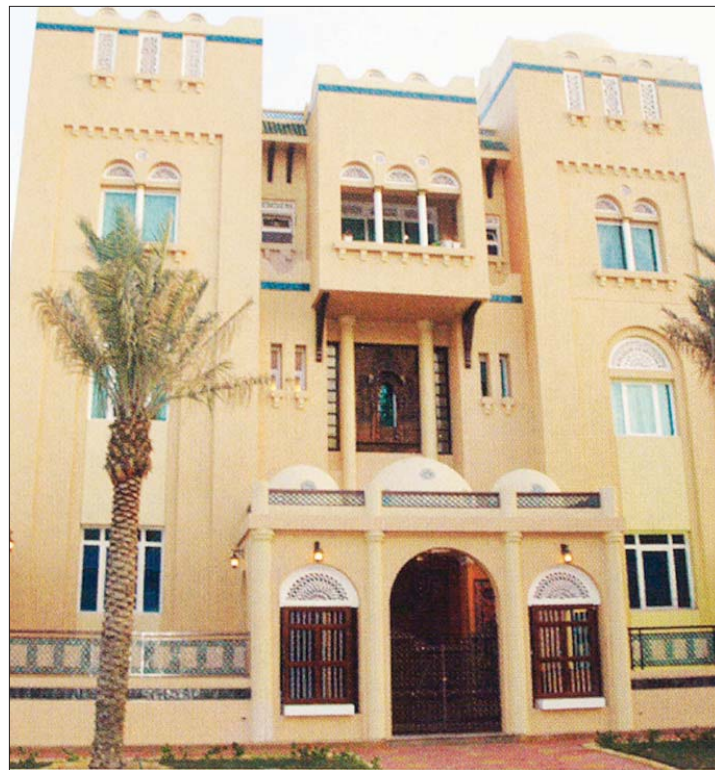
• واجهة متحف الفن الإسلامي