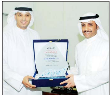
مرزوق الغانم يتلقى درعاً تذكارية من الهويدي

أشاد رئيس لجنة الشباب والرياضة بمجلس الأمة النائب المهندس مرزوق الغانم باللاعب الدولي جاسم الهويدي وما قدمه من عطاء كبير وجهه لا يخفى على اي رياضي طيلة فترة مشواره مع الكرة الكويتية سواء مع الأزرق او مع السالمية، واصفا اياه بأنه خير سفير للاعب الكويتي في الخارج. وقال الغانم لدى استقباله اللاعب الهويدي، بمناسبة اعتزاله 14 نوفمبر في مباراة الكويت وإيران، ان جاسم الهويدي اعطى صورة رائعة للاعب الكويتي بخصوله على لقب هدف العالم، وقيادته للأزرق في بطولة الخليج وتمتعه بنجومية غير عادية اوصلته الى قلوب الجماهير الرياضية التي أسعدتها الهويدي بأهدافه الجميلة ومستواه الراقى. وأكد الغانم ان الهويدي نجح في مسيرته الكروية ونجح كذلك في مهمته الاحترافية في الخليج، وقدم صورة رائعة للرياضي الكويتي وكان نجماً وهدافاً لا ينشق له غبار، وقدمه للبراعم بأخلاقه ومستواه العالي، ويعز علينا وداع أحد اللاعبين المتميزين الذين ابدعوا في الحقيقة ووضعوا الفرحة مراراً في قلوب الجماهير.