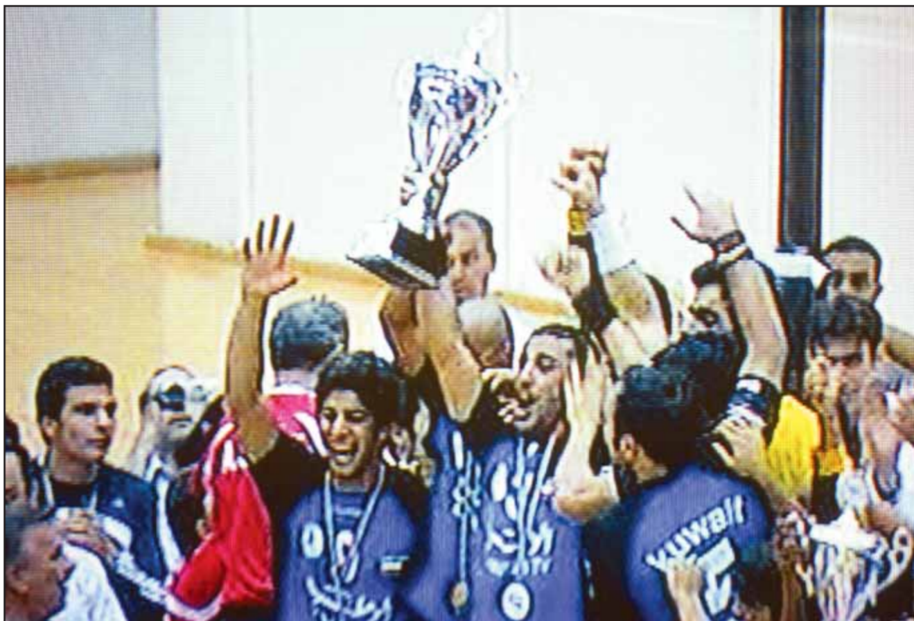
ناصر بوخضرا يرفع كأس آسيا

يعود الوفد الى البلاد في الساعة الثانية والرابع من عصر اليوم، قادما من العاصمة الأردنية عمان، وسيجري له استقبال رسمي في صالة التشریفات بمطار الكويت.